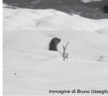
Immagine di Bruno Usseglio

In alta montagna gli animali si risvegliano dal letargo invernale.